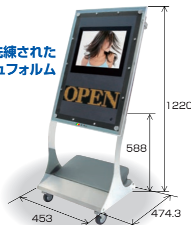
アップードスタンド